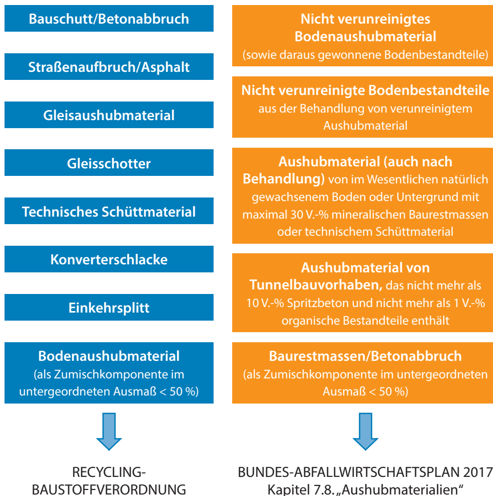
Abb. 2 Übersicht Inputmaterialien gemäß RBV bzw. BAWP 2017